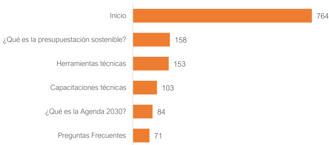
Gráfica 2. Número de visitas por secciones del sitio web de la Mesa de Ayuda

De igual manera, como se muestra en la Gráfica 2 y con base en el comportamiento de los visitantes, las secciones más visitadas están relacionadas con el material técnico necesario para avanzar en una presupuestación sostenible, ya que el interés se enfoca en conocer qué es la presupuestación sostenible y las herramientas técnicas diseñadas.